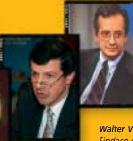
Oldrich Vlasak Membro del Parlamento europeo Presidente delegato