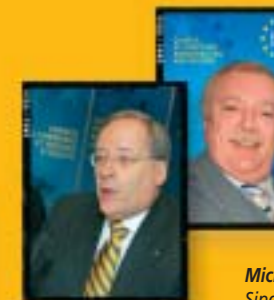
Wim Deetman Sindaco dell'Aia Primo Vicepresidente