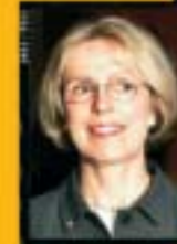
Bärbel Dieckmann Sindaco di Bonn Presidente delegato