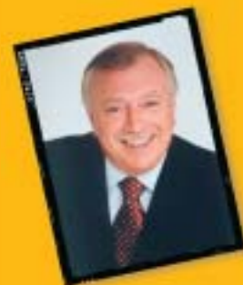
Michael Häupl, Presidente del CCRE dal 2005