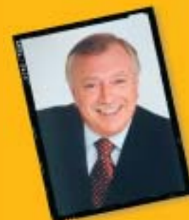
Michael Häupl, Przewodniczący CEMR od 2005 roku