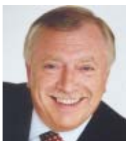
Dr Michael Häupl Bürgermeister von Wien; Präsident des österreichischen Städtebundes