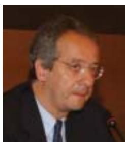
Walter Veltroni Bürgermeister von Rom