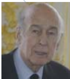
Valéry Giscard d'Estaing Präsident RGRE