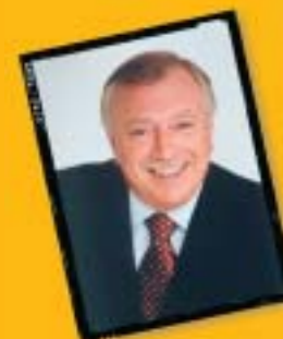
Michael Häupl, Przewodniczący CEMR od 2005 roku