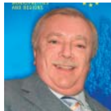
Michael Häupl Président du CCRE

Nous nous réjouissons de vous accueillir prochainement à Rhodes.